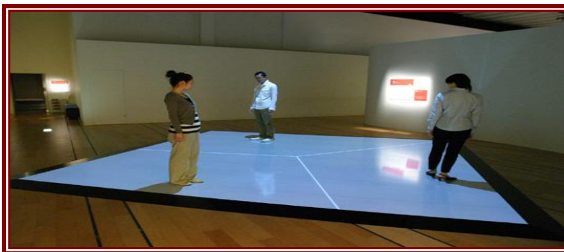
شکل ۱: مرزبندی بین انسان‌ها

توان گفت انسان‌ها در زمینه‌های مختلف معنوی و مادی با یکدیگر تفاوت دارند و این تفاوت سبب شکل دادن به مرزبندی بین آن‌ها می‌شود (شکل (۱)) (حافظنیا و جان‌پرور، ۱۳۹۲: ۲۸-۲۷).