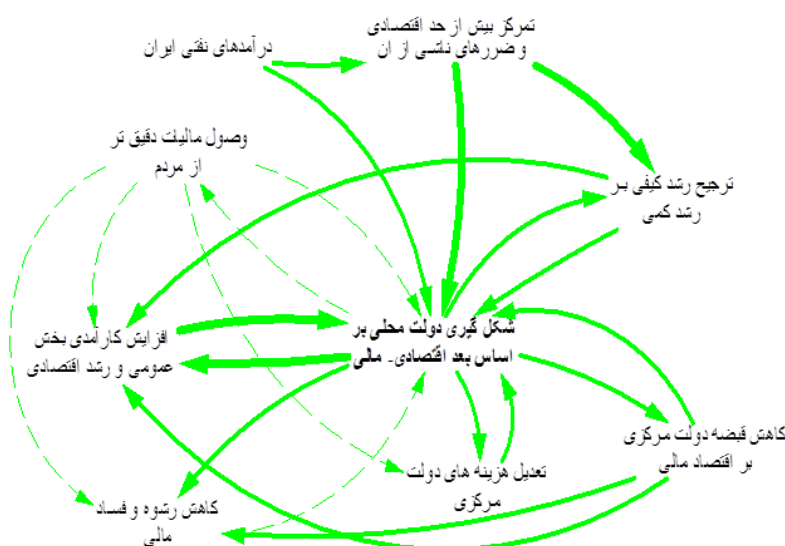
شکل ۲- دیاگرام زیرسیستم بعد اقتصادی - مالی

از تحلیل‌های داده‌های کمی و بخش کیفی برخی از این عوامل در شکل‌گیری دولت محلی از اهمیت و اولویت بالاتری نسبت به سایر عوامل برخوردارند. روابط این عوامل با عوامل دیگر موجود در سیستم باضخامت متفاوت و بیشتری نمایش داده شده‌اند.