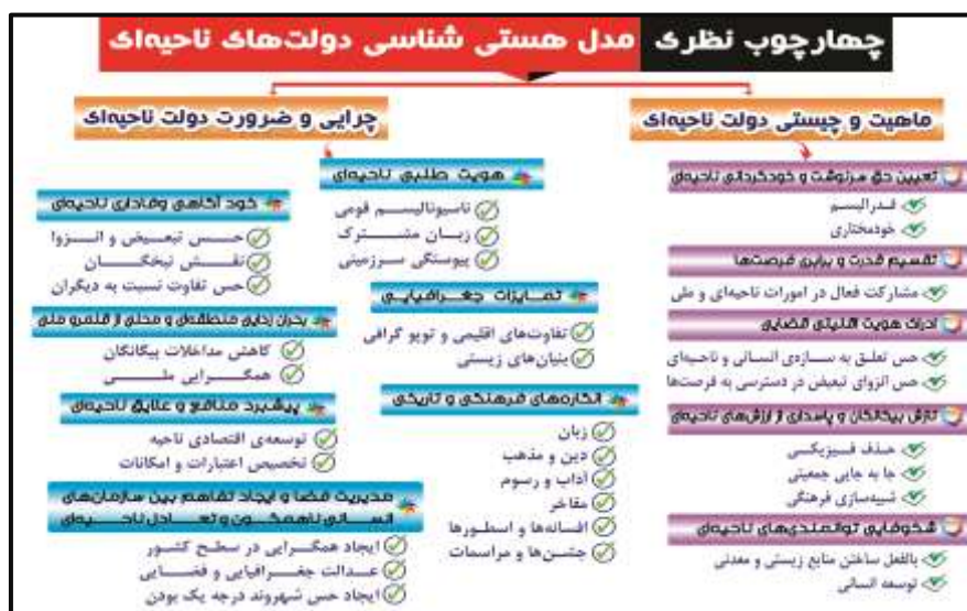
مدل ۲. چهارچوب نظری هستی‌شناسی دولت‌های ناحیه‌ای (Authors)

واگرایی ناحیه‌ای داده و گروه‌های قومی که به‌خود آگاهی رسیده‌اند، به‌مرور، خود را به‌عنوان سازه‌های مجزا و منفک از پیکره ملی قلمداد خواهند کرد.