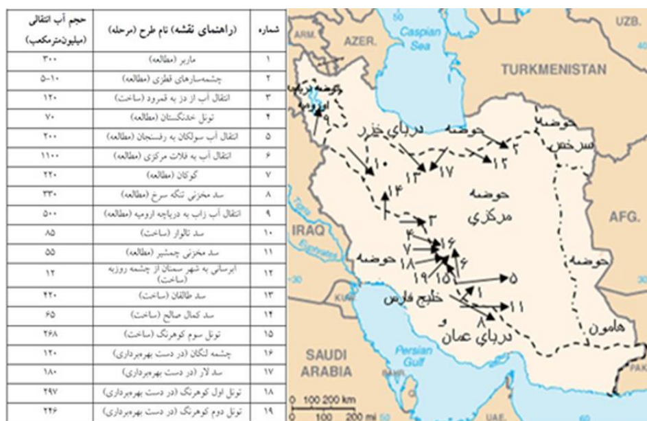
شکل ۱- موقعیت جغرافیای انتقال بین حوضه‌ای آب در ایران

طرح‌های انتقال بین حوضه‌ای ۳۹۸۰ میلیون مترمکعب خواهد شد (Iran Jamab CO, 1999:241). وضعیت جغرافیای انتقال آب بین حوضه‌ای در ایران را می‌توان در نقشه شماره (۱)، مشاهده نمود.