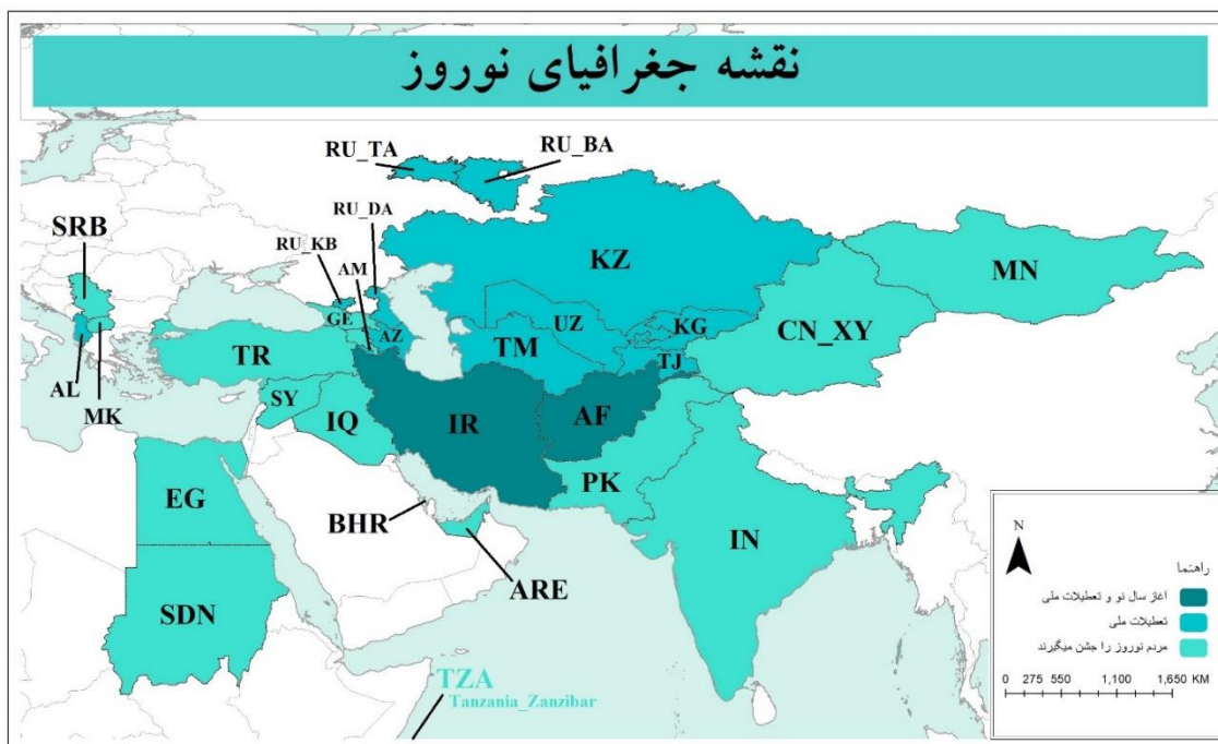
شکل ۱. نقشه جغرافیای نوروژ

سال جشن گرفته می‌شود. این جشن توسط بیش از ۳۰۰ میلیون نفر در سراسر جهان و برای بیش از ۳۰۰۰ سال در بالکان، حوزه دریای سیاه، قفقاز، آسیای مرکزی، خاورمیانه و سایر مناطق برگزار شده می‌شود (Resolution the General (Assembly, 2010).