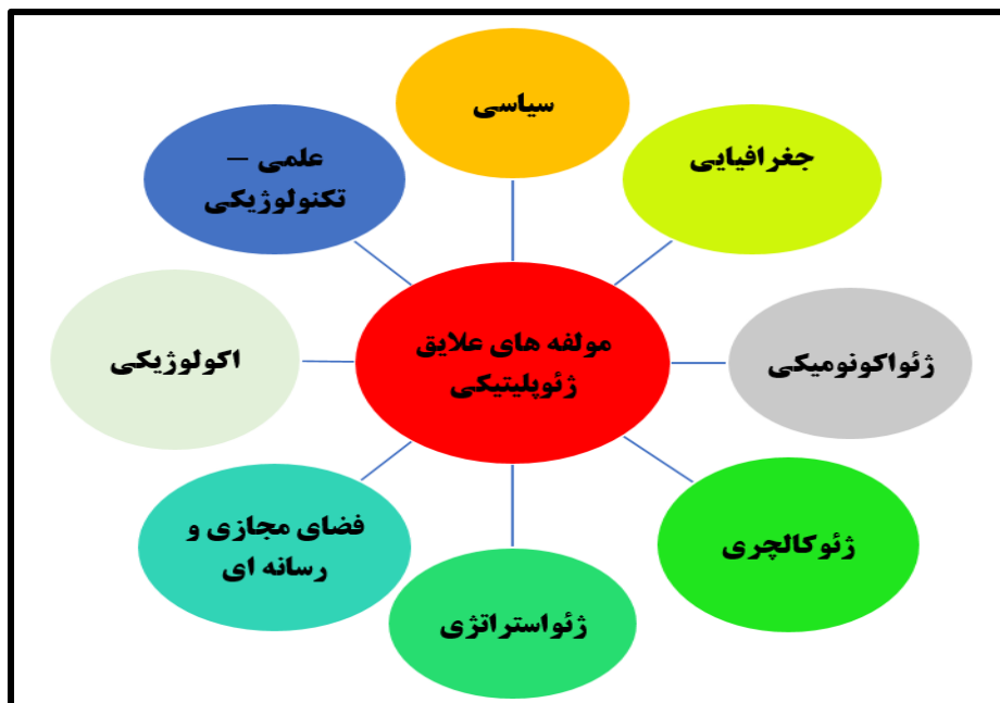
شکل شماره ۱: ابعاد هشت گانه علایق ژئوپلیتیک ترسیم از نگارنده.

اکولوژیکی و فضای مجازی و رسانه‌ای هم پرداخته شود؛ تا بتوان الگوی جهان شمولی را برای علایق ژئوپلیتیک ترسیم کرد.