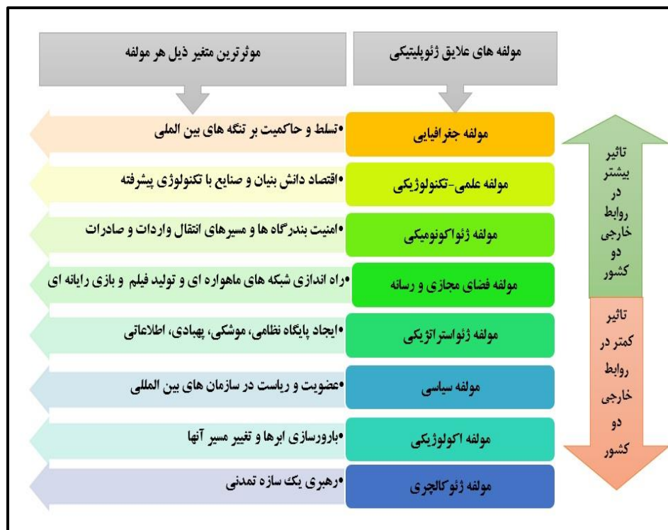
شکل شماره ۲- میزان تاثیرگذاری مولفه‌ها و متغیرهای علائق ژئوپلیتیکی ترسیم از نگارندگان

بالاترین رتبه‌ها را به خود اختصاص داده‌اند. از سوی دیگر مولفه‌های ژئوکالچری، اکولوژیکی و سیاسی تاثیر کمتری نسبت به سایر مولفه‌ها داشته‌اند.