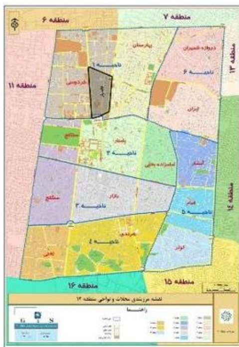
نقشه شماره ۱: نقشه محدوده‌ی مورد مطالعه

همچنین قلمرو زمانی پژوهش حاضر بین سال‌های ۱۳۹۸ تا ۱۳۹۹ میلادی است. قلمرو موضوعی نیز مطالعه بازآفرینی شهری در خیابان لاله‌زار بر اساس رویکرد فرهنگ مبنا است.