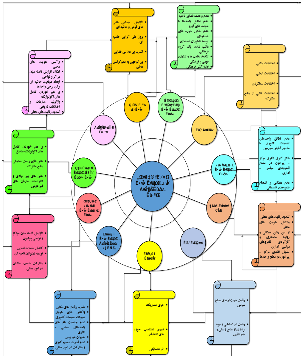
شکل شماره ۲: الگوی عوامل و منابع تنش و منازعه میان قلمروهای سیاسی - اداری تقسیمات کشوری (Authors).