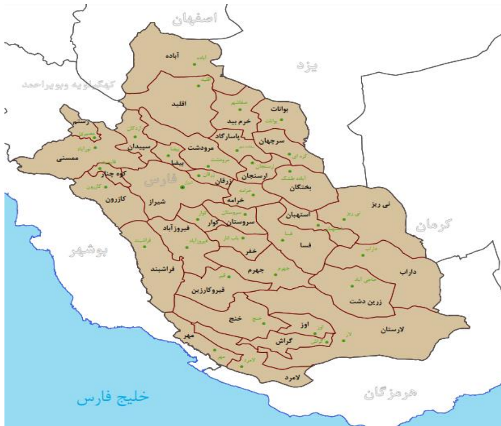
شکل شماره ۱: نقشه تقسیمات کشوری استان فارس در سال ۱۴۰۰ (Iran Statistics Center)