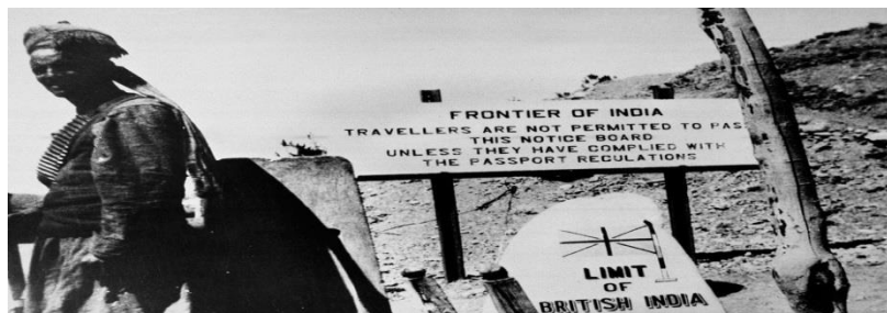
عکس. ۱: سرحد بین هندبرتانوی و افغانستان

هرچند انگلیسی‌ها که روابط دوستانه‌ای با پادشاهان افغانستان داشتند و مایل بودند تا افغانستان به عنوان یک منطقه بی-طرف با مرزهای سیاسی مشخصی از جانب روسیه به رسمیت شناخته شود اما مدتی زمان لازم بود تا روسیه نیز به این مسئله رضایت دهد. در واقع وقتی روسیه پس از شکست در جنگ با ژاپنی‌ها در ۵ سپتامبر ۱۹۰۵ مجبور شد پیمان صلحی را با این کشور امضاء کند، کم‌کم به پایان بازی بزرگ نزدیک می‌شویم. در ادامه روس‌ها و انگلیسی‌ها در توافق-