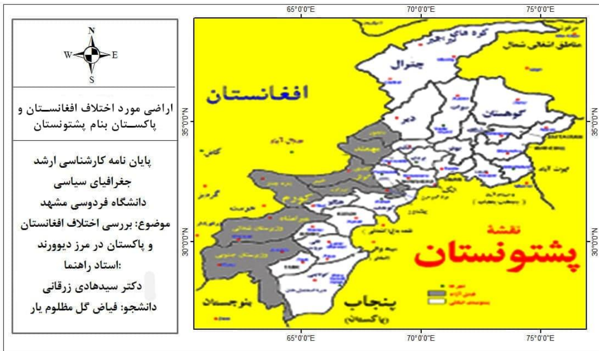
نقشه: ۳ اراضی مورد اختلاف افغانستان و پاکستان بنام پشتونستان

انگلستان را در مورد اینکه دره کنر تا اسمار و علاقه بیرمل در وزیرستان جزء افغانستان باشد را به دست آورد و طرفین توافق کردند تا مرزبندی در خود محل توسط هیئت‌های مختلف صورت گیرد. در برابر این همه گذشت‌های طرف افغانی حکومت انگلیس فقط حاضر شد تا کمک مالی به دولت امیر عبدالرحمن خان را افزایش دهد: (HaghJo, 2001: 163-164). انگلیس‌ها برای جداسازی این مناطق وسیع و حیاتی از افغانستان، فعالیت‌های جنگی، جاسوسی، تبلیغی و تخریبی زیادی در افغانستان انجام دادند. به نظر می‌رسد خط دیورند و محروم کردن افغانستان از آب‌های آزاد، طرحی بود که انگلیس آگاهانه آن را تعقیب می‌کرد. از این طریق انگلیس‌ها اهرم نیرومندی در اختیار داشتند که افغانستان را به‌طور کامل وابسته به آن‌ها می‌کرد، زیرا ارتباط آن‌ها با جهان خارج فقط از هندوستان می‌گذشت (Saadat, 2017: 179).