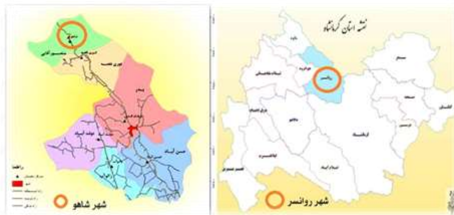
شکل ۱. نقشه موقعیت شهر شاهو در تقسیمات سیاسی استان کرمانشاه

جدول ۱. تعداد جمعیت، خانوار و شهرستانها و مراکز شهری منطقه اورامانات مطابق آمار سال ۹۵