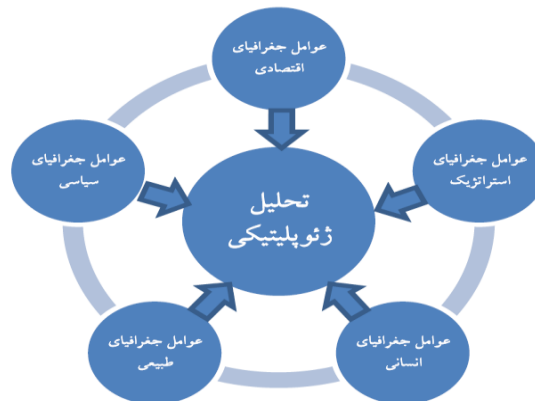
شکل ۱- عناصر تحلیل ژئوپلیتیک

توجه شود. اگر چه ممکن است در همه تحلیل‌ها همه عوامل نقش نداشته باشند. شکل شماره ۱ عناصر تحلیل ژئوپلیتیک را نشان می‌دهد.