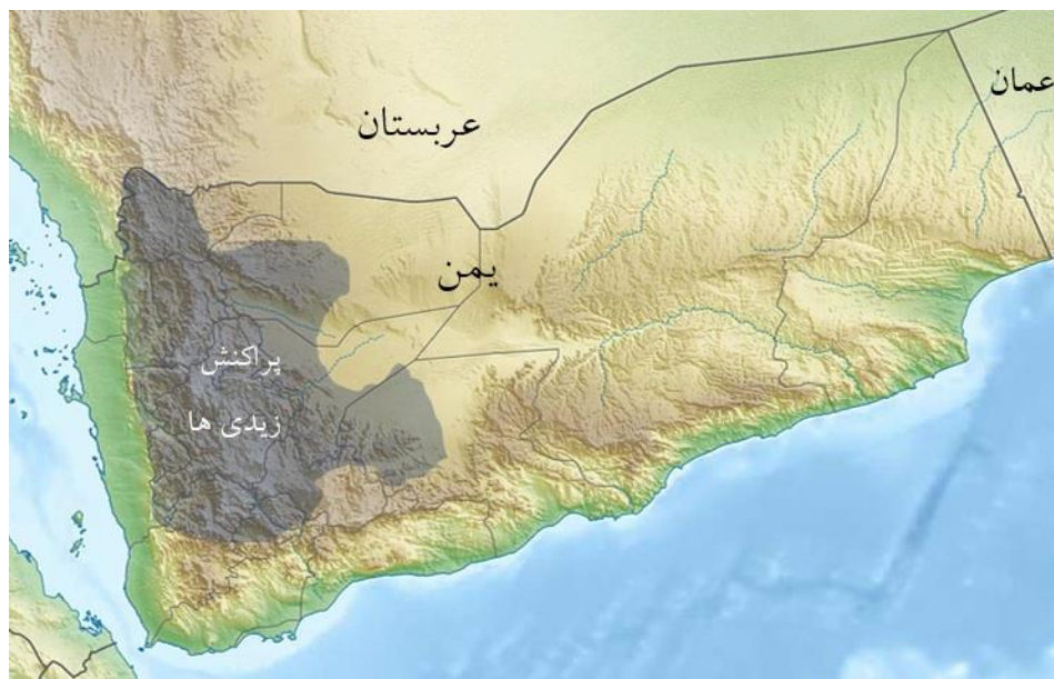
نقشه ۱- همپوشانی تنوعات توپوگرافیکی یمن با تنوعات انسانی (مذهبی)

گذشته نیز تجربیات سیاسی متفاوتی را از سر گذرانده‌اند که از جمله آن تقسیم این دو بخش به دو واحد سیاسی مستقل از هم بود. بخش‌های کوهستانی یمن به دلیل صعب‌العبور بودن، کمتر مورد تعرض قرار گرفته و بافت اجتماعی آن نیز یکدست‌تر می‌باشد ولی بخش‌های هموار و بویژه دشتهای ساحلی تحت تأثیر فرهنگ و ارتباطات مختلف بوده است و حتی خلق و خوی انسانها نیز با قسمتهای کوهستانی عموماً متفاوت است. جغرافیای طبیعی این کشور باعث شده حتی با وجود اینکه نزدیک به ۳۰ سال از اتحاد یمن شمالی و جنوبی می‌گذرد، هنوز جریانهای ناحیه‌گرایی در هر دو بخش کوهستانی و دشتهای ساحلی قوی است و بخصوص در بخش‌های زیادی از یمن جنوبی سابق به مرکزیت شهر عدن جنبش جدایی طلبی از شمال با قدرت زیادی فعال است. عوامل جغرافیای طبیعی در سالهای پس استقلال نیز مانع از ادغام مردم یمن در قالب یک ملت واحد شده و فرایند ملت‌سازی را با اختلال جدی روبرو کرده است و امروزه نیز بخشی از درگیری‌های این کشور حاصل نقش عوامل جغرافیای طبیعی است. نقشه شماره ۱ جغرافیای طبیعی و زمینه‌سازی این عوامل برای تنوعات انسانی این کشور را نشان می‌دهد. همچنانکه مشخص است تنوعات انسانی این کشور بویژه از جنبه مذهبی تا حد بسیار زیادی با تنوعات توپوگرافیک آن همخوانی دارد.