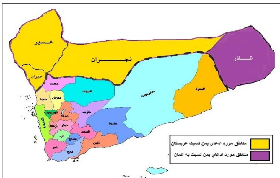
نقشه ۳- ادعاهای ارضی یمن نسبت به عربستان و عمان

است، به طوری که شامل دو سوم جنوب آن کشور می‌شود. عربستان سعودی ادعا کرده است که مناطق نفت خیز یمن مانند «مأرب»، «جوف»، «ربع الخالی» و «حضر موت» متعلق به آن کشور است. به علت وجود اختلاف بر سر مناطق مذکور، مرزهای بین عربستان سعودی و یمن تاکنون نه روی نقشه و نه روی زمین تحدید نشده است (Jafari Valadani, 1993: 49). همچنین بند ۵ پیمان طائف می‌گوید هیچ دیوار یا استحکامات مرزی نباید در امتداد خط مرزی کشیده شود. عربستان سعودی با ادعای افزایش قاچاق، پروژه فَنس‌کشی را در سال ۲۰۰۳ در امتداد مرزهای خود شروع کرد که با اعتراض یمن ساخت دیوار و فنس تا حدودی متوقف شد (Saber, 2015; 2-9). به طور کلی مردم یمن هرگز حاضر نشدند واگذاری عسیر به عربستان سعودی را بپذیرند به همین جهت پس از امضای معاهده طایف امام یحیی توسط کسانی که مخالف واگذاری عسیر به عربستان سعودی بودند کشته شد و فرزندش امام بدر جانشین وی گردید (Nyrop, 1977: 27). آنچه در گذشته سبب شده که دو کشور در صدد تحدید مرزهای خود برنایند، فقدان فعالیت‌های اکتشافی در مناطق مرزی بوده است. قبلاً شرایط سخت طبیعی مانع از کاوش در این مناطق شده بود و ضرورتی هم برای تحدید مرزها احساس نمی‌شد. نقشه شماره ۳ ادعاهای ارضی یمن نسبت به سه استان در عربستان و یک استان در عمان را نشان می‌دهد.