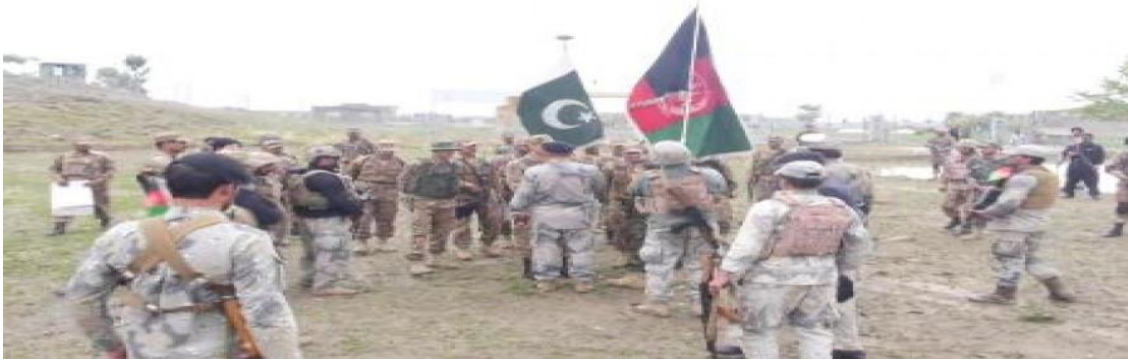
عکس ۳: درگیری مرزبانان افغان و پاکستان در امتداد مرز دیورند

https://www.avapress.com/fa/news/162104/%D8%AA%D9%86%D8%B4